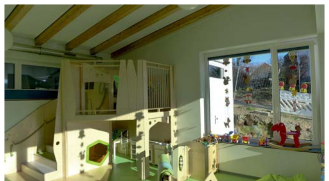
Gruppenraum mit Spielbereich