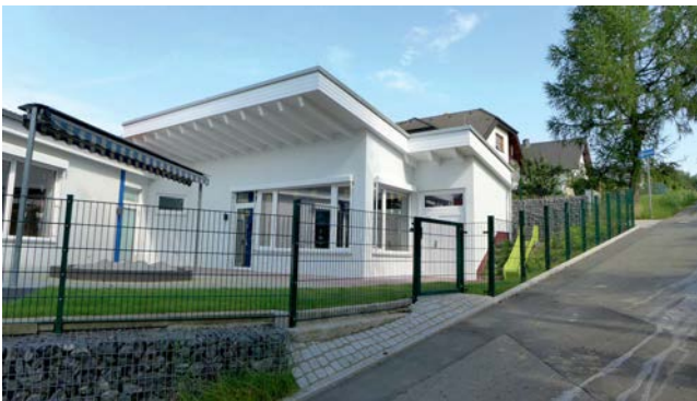
Ansicht Neubau + Erweiterung