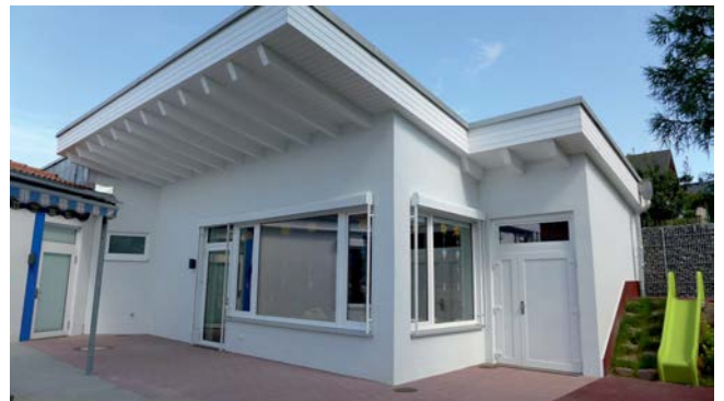
Südansicht mit Außengeräterraum