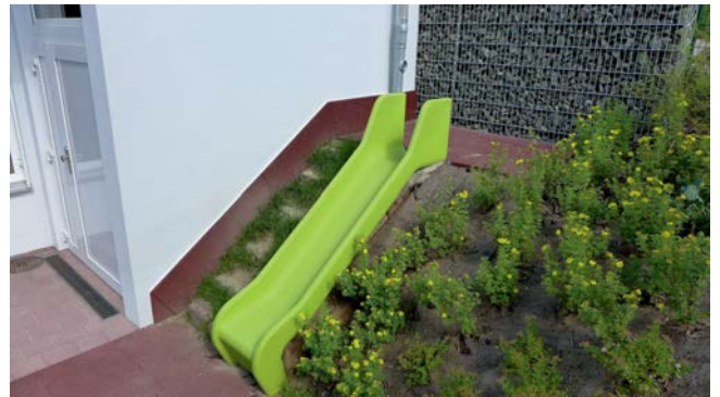
Außenanlagen (Rutsche) neben Außengeräterraum