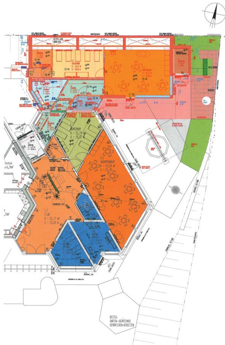
Grundriss Kinderkrippe (Neubau + Erweiterung)